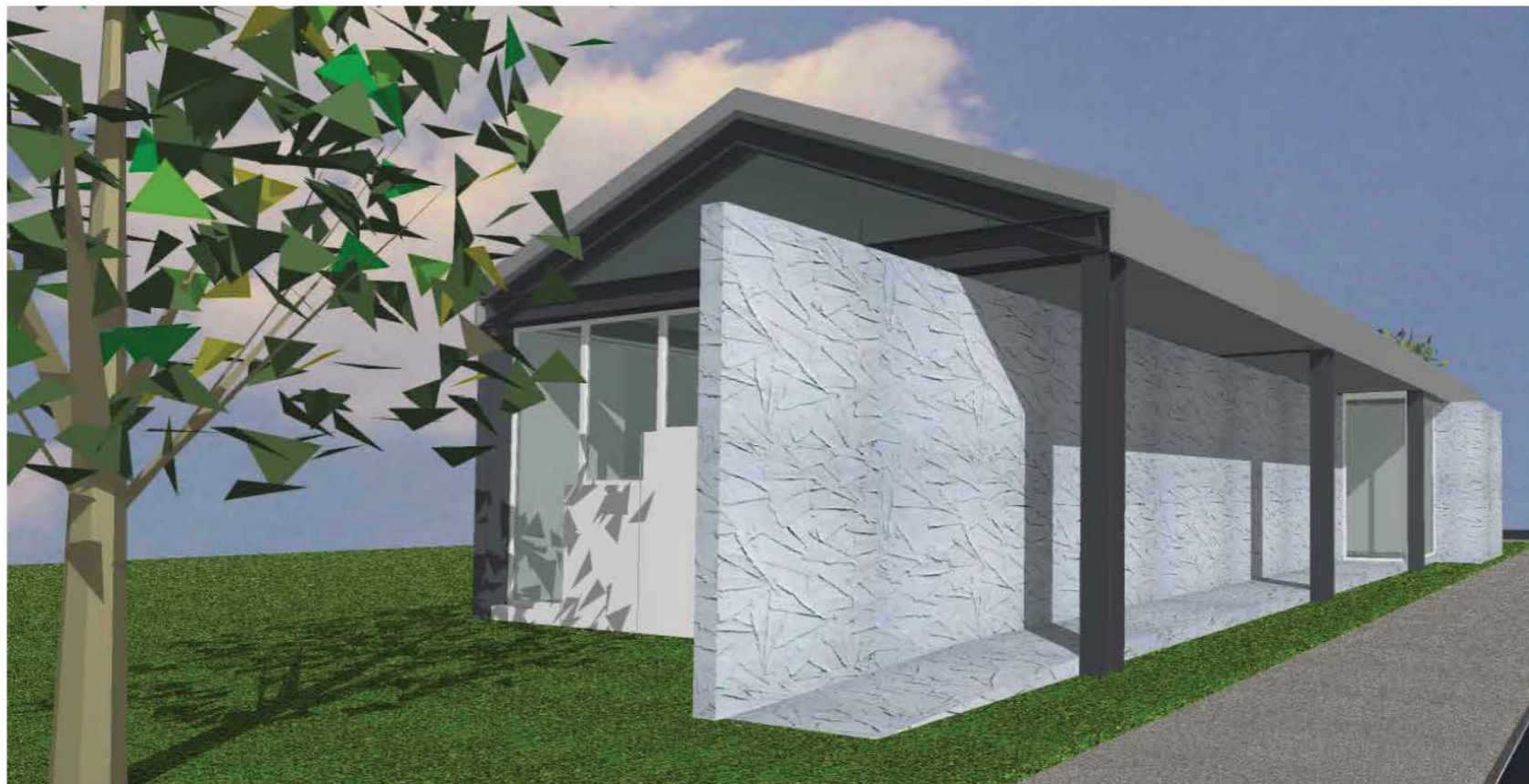
ACCESO AL PORCHE DE ENTRADA