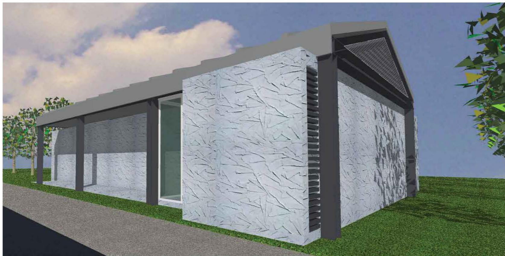
FACHADA HACIA CALLE - ENTRADA PRINCIPAL